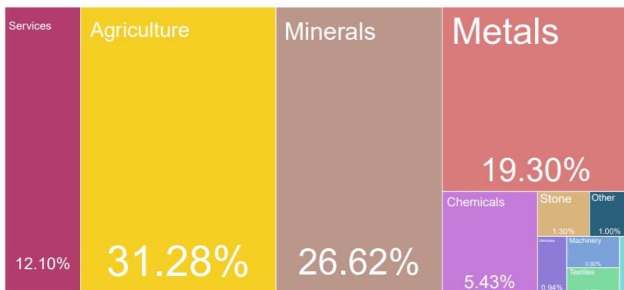
Gráfico 1: Distribución de exportaciones en Chile según categorías de bienes en porcentaje, año 2019